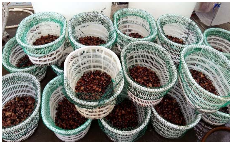
3. 文蛤“万里2号”新品种培育与推广应用